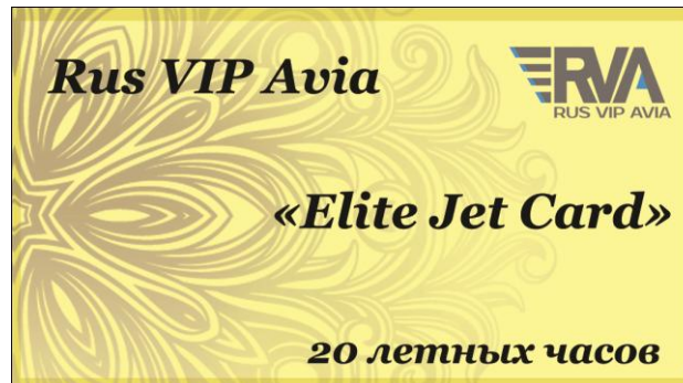
Карта «Elite Jet Card», 20 ч