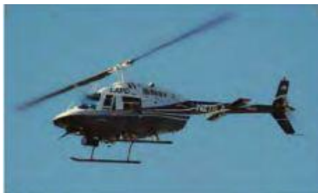
Bell 206 (206В-3 и 206Д-4)

пробок переместиться по городу или провести для своих партнеров обзорную экскурсию. Эта услуга подойдет для участников корпоративных мероприятий.