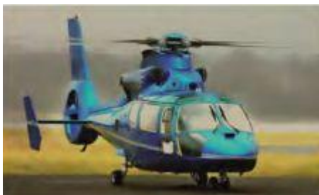
Eurocopter AS365N3 Dauphin

Экипаж: _____ 3чел. Пассажировместительность: ___до 20чел. V макс.: _____ 250км\ч V крейс.: _____ 225км\ч Дальность полета: _____ 400-500км Длительность полета: _____ 4,07часа Максимальная высота: _____ 4200м